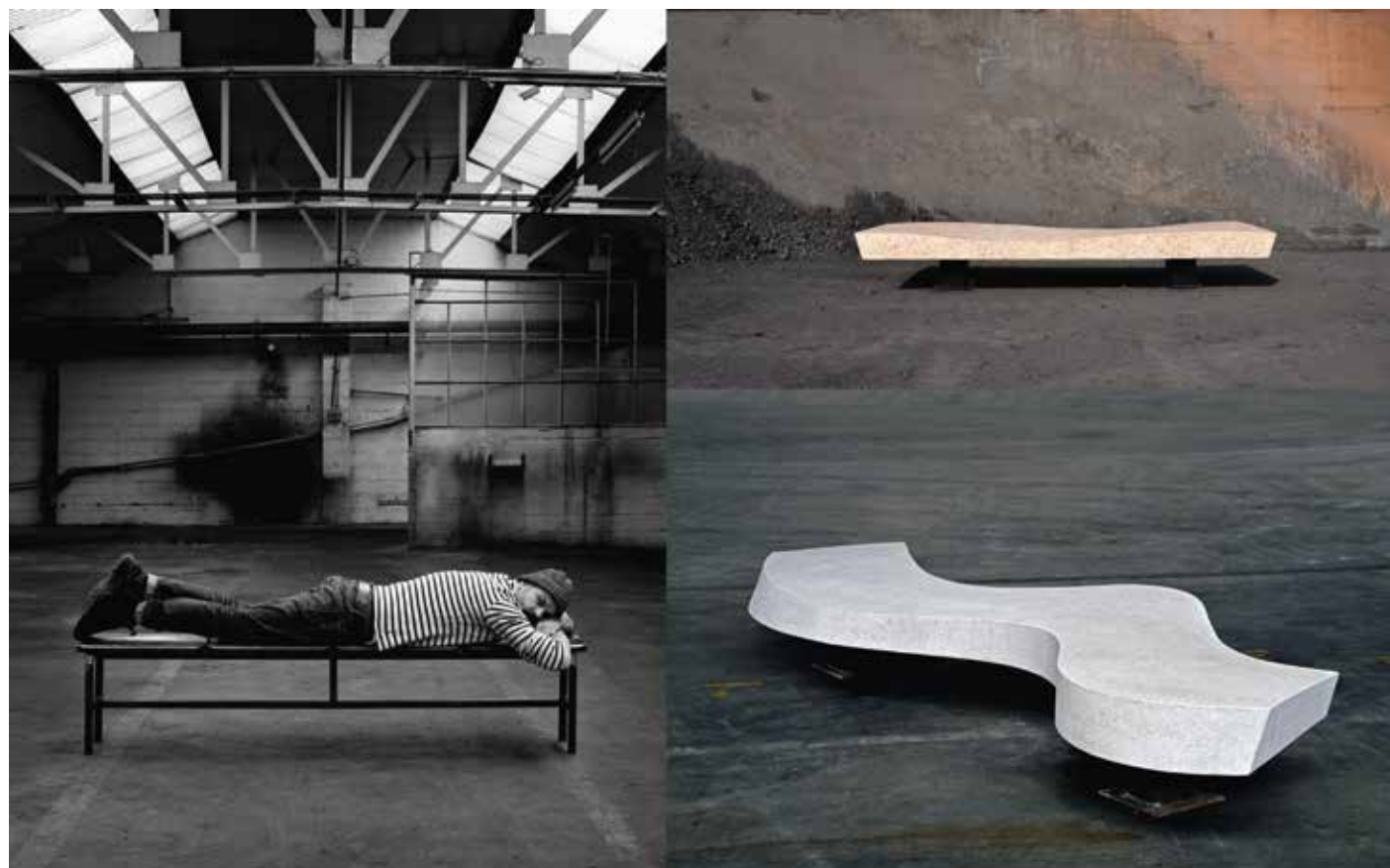
De werkplaats van Paul Koenen is een oude tin- en aluminiumgieterij in de buurt van Tongeren. Zijn banken ademen de geest van de huidige tijd; het zijn objecten van ultieme verstillig. Minimalistisch maar vol verbeeldingskracht.